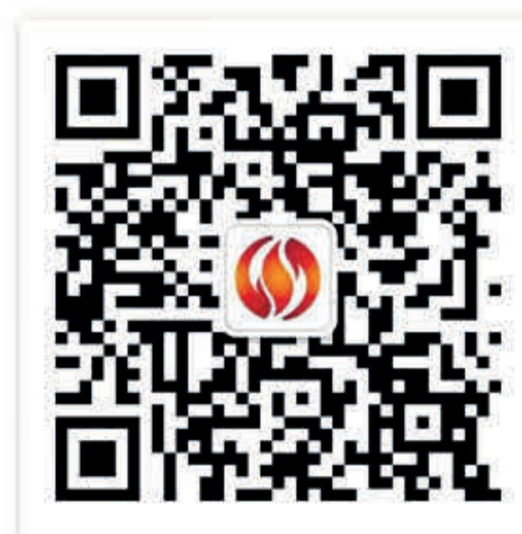
上交所投教公众号

本手册仅为投资者教育之目的，不构成任何投资建议。上海证券交易所力求本手册刊载的信息准确可靠，但对这些信息的准确性或完整性不作保证，亦不对因使用该等信息而引发或可能引发的损失承担任何责任。更多内容请浏览上交所投资者教育网站 ( http://edu.sse.com.cn )、基础设施 REITs 专栏 ( http://www.sse.com.cn/reits/home/ ) 或关注“上交所投教”微信公众号。